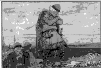
Репродукция картины В.М. Васнецова «Прощание Олега с конём»